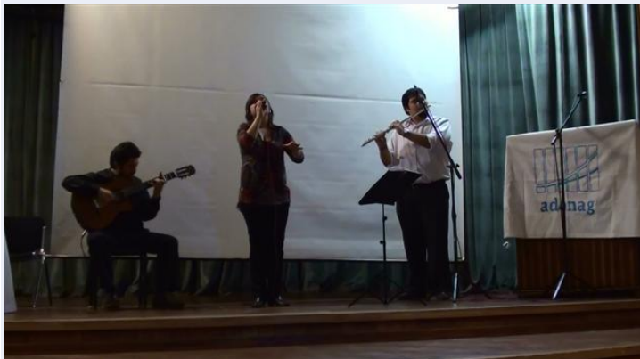
Número artístico del acto de apertura del Encuentro, a cargo de músicos locales.