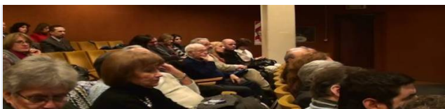
Vistas parciales del Aula Magna de la UNLPam en donde se llevó a cabo el acto de apertura del XXVII Encuentro Nacional de ADENAG.